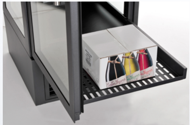
Die Ausstattung mit Vollauszügen ist wahlweise auch nur oben oder unten möglich.