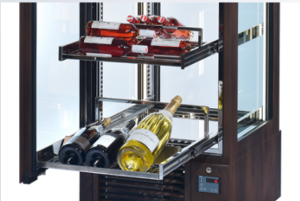
Auflagesystem HZ 1 und HZ 2 mit Vollauszug; Kombination mit Magnumhalterung + Bügel für individuelle Schrägstellung.