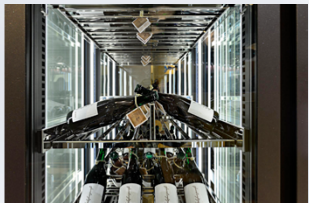
Um 90° gedreht montierbare Auflagesysteme sorgen für perfekte Rundum-Präsentation.