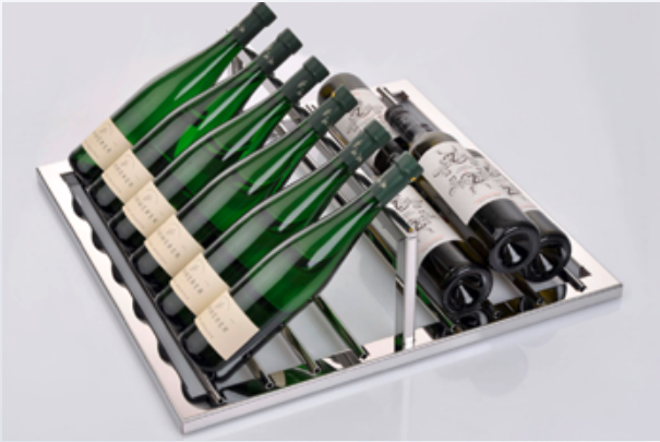
Auflagesystem HZ 2 mit nach vorne und hinten verstellbarem Bügel für optimale Präsentation von kleinen und großen Flaschen.

Unsere Weinklimaschränke beeindrucken mit einem besonders gelungenem Design und überzeugen mit funktionellen Highlights: maximales Fassungsvermögen, perfekte Lagerbedingungen, optimale Präsentation, für unterschiedliche Flaschengrößen anpassbar und leichte Erreichbarkeit der einzelnen Flaschen dank optionalem Vollauszug der einzelnen Auflagen – das alles dürfen Sie von unseren Weinklimaschränken erwarten.